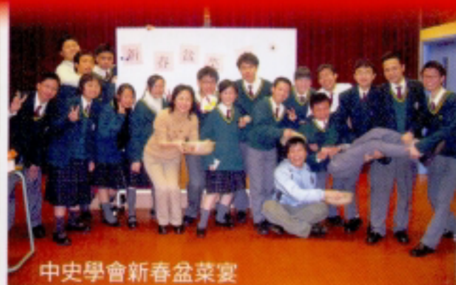
中史學會新春盆菜宴

「讀萬卷書，不如行萬里路。」為了讓中一至中五同學對中國歷史有更深入的認識，中史學會舉辦了一連串的活動，讓同學一開眼界。