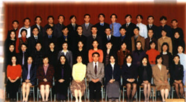
一起承擔教育使命的全體教職員