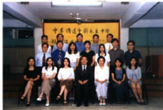
共渡創校艱辛的第一屆同工