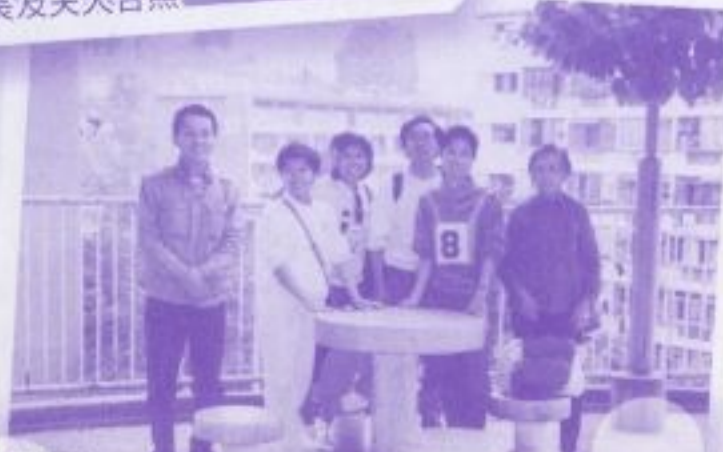
校長在1990年與部分家人重返田灣舊居拍攝，左一為校長。